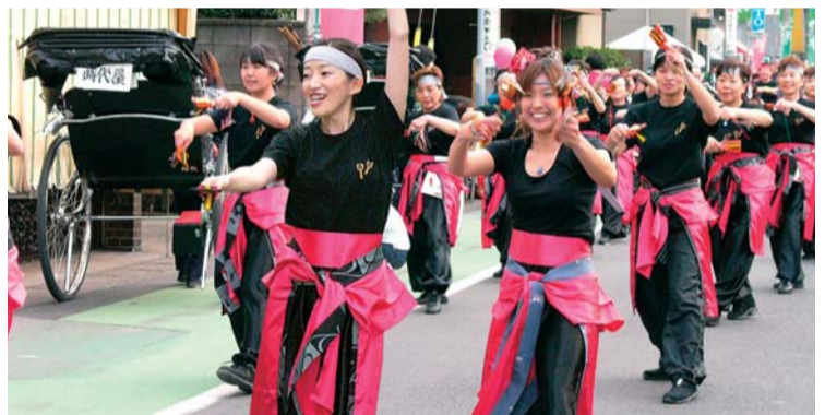
昨年秋の宿場祭りで、よさこい踊りを踊る

草加市では市民の活動が盛んです。各地域でのまちづくりや、市民活動、スポーツや文化活動など、市民の元気が草加の元気です。特に今年は、日光街道の宿場としての草加が、開宿着手400年を迎える節目の年でもあります。2003年より、「今様・草加宿」として、地域再生事業が行われています。世代を超えて、伝統と文化の上に、現代の草加のまちを、市民と行政が共に築いていく取組みをしています。