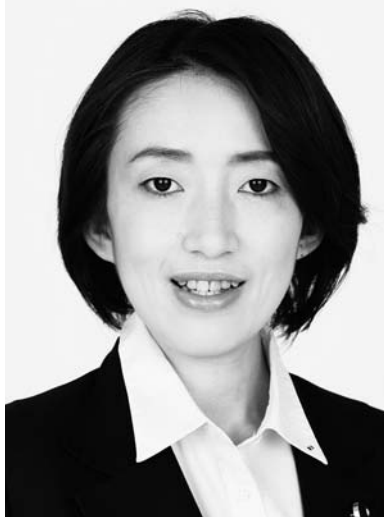
埼玉県議会議員 山川百合子