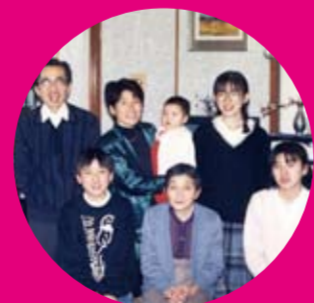
大学生時代、家族との集合写真